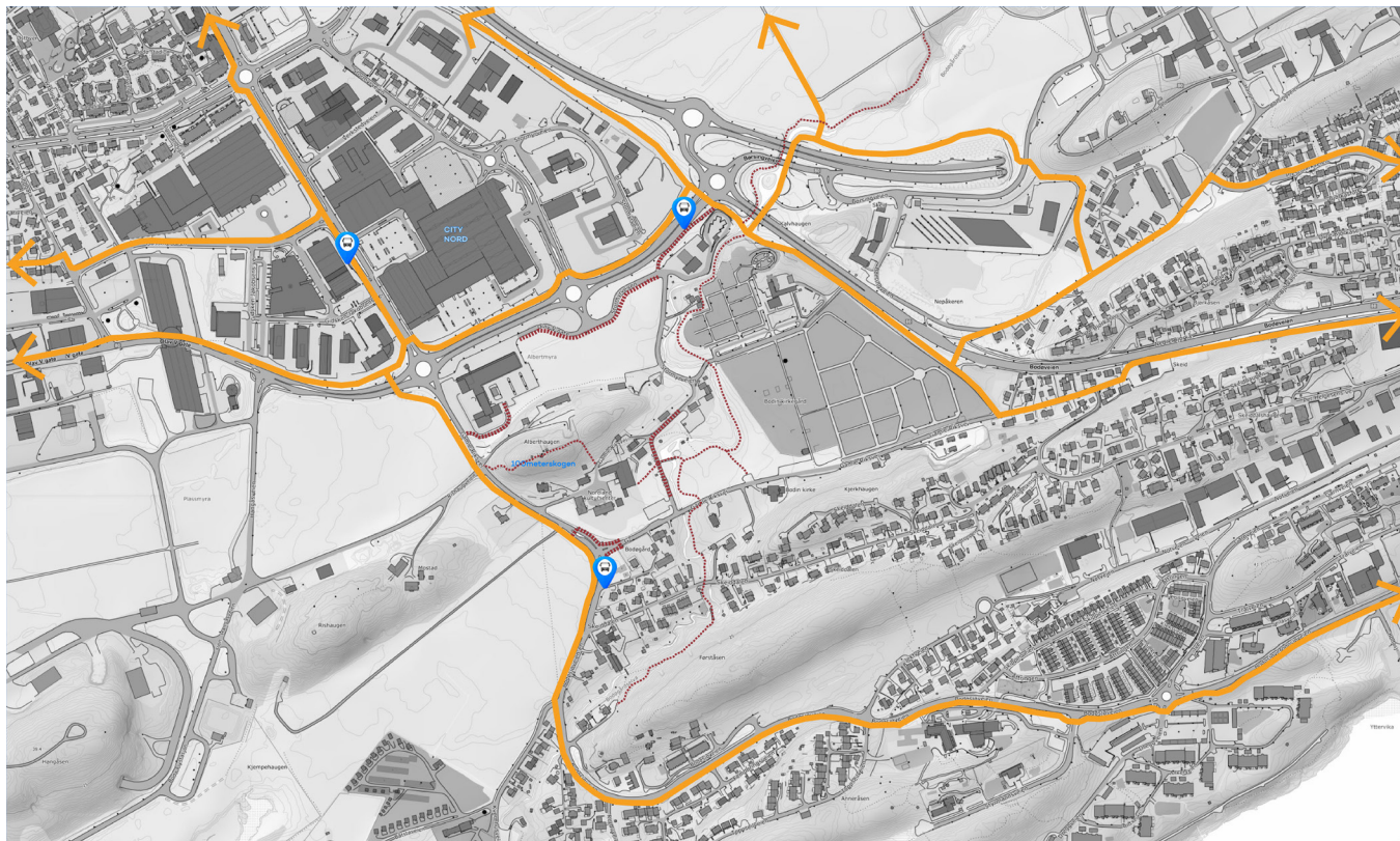
Kommunedelplan for sykkel 2018 - 2025

Ved å forstå det større bildet kan man sikre at de nye traseene blir en integrert del av det eksisterende nettverket og gir gode forbindelser for myke trafikanter i hele området.