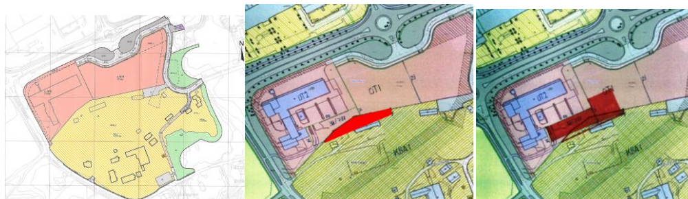
Fig. 2 Gjeldende reguleringsplan (t.v.), teigen som skal avhendes (midten) og ønsket plassering av Samvirkesenter Nord (t.h.)

Gjeldende reguleringsplan for området (områderegulering for Albertmyra og omegn, planid 1297) er fra 2013. I forbindelse med plassering av Samvirkesenter Nord i tilknytning til den eksisterende nødsentralen på Albertmyra, er det ønskelig å ta i bruk en mindre eiendomsteig i utkanten av Alberthaugen, som er omfattet av hensynssone for bevaring av kulturmiljø (H570) i gjeldende reguleringsplan. Avhending av teigen er vedtatt i fylkesrådet i fylkesrådssak 165/2023.