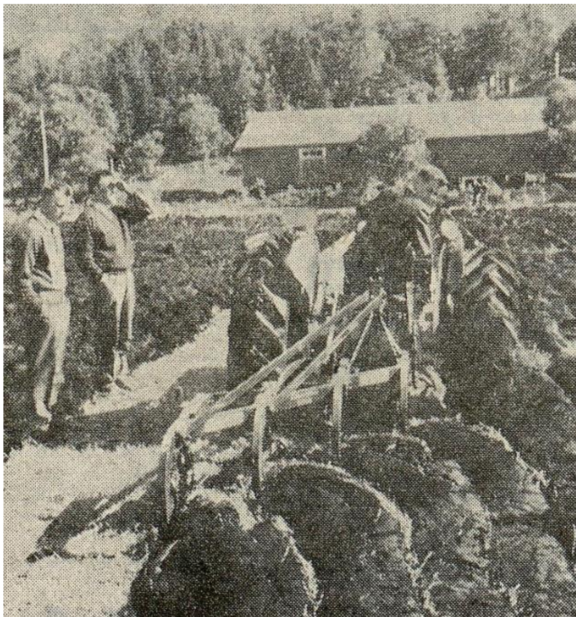
Fig. 9 Fra pløyekonkurransen under «Teknikk og Tanke». Det antas at det er potet- og grønnsakslageret som er under oppføring i bakgrunnen.

Instituttet hadde planlagt og bygd en driftsbygning for 15 melkekyr, et redskapshus med garasje, et uisolert fjøs for 30 sauer og et potet- og grønnsakslager. Instituttet hadde også en betjent stand for visning av bygninger samt bygningsdetaljer med materialer og utstyr til driftsbygninger (Nygaard 1985:93).