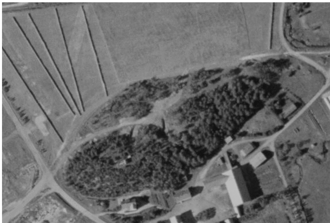
Fig. 7 Flyfoto fra 1946. Ingen bygninger er oppført på nordsiden av Alberthaugen på dette tidspunktet.

Det røde huset som i dag disponeres av Nordland Kultursenter, ble i en featureartikkel i Nordlandsposten 21. februar 1988 presentert som et minne fra den tyske okkupasjonen. Det kan ikke stemme, ettersom et flyfoto tatt umiddelbart etter 2. verdenskrig, ikke viser noen bygninger i området nord for Alberthaugen.