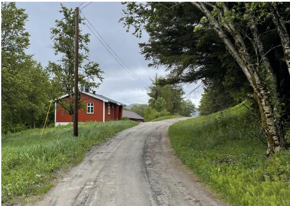
Fig. 4 Bolighuset («hytta»), med lagerbygningen i bakkant.

I forbindelse med reguleringsprosessen som ble avsluttet i 2013, gjennomførte Nordland fylkeskommune arkeologiske registreringer på Albertmyra (Mjaaland 2012). Det ble påvist et areal med forhistoriske bosetningsspor der brannstasjonen nå er lokalisert. Arealet ble avsatt som bestemmelsesområde i reguleringsplanen, og senere arkeologisk undersøkt (utgravd) av Tromsø museum (Henriksen og Niemi 2014). I arbeidet med notatet har det vært dialog med kulturminneforvaltningen i Nordland fylkeskommune, som opplyser at det ikke er behov for ytterligere arkeologiske registreringer i forbindelse med den pågående detaljreguleringen (omreguleringen). Fylkeskommunen ønsker imidlertid mer informasjon om de to nevnte bygningene, som del av sitt beslutningsgrunnlag.