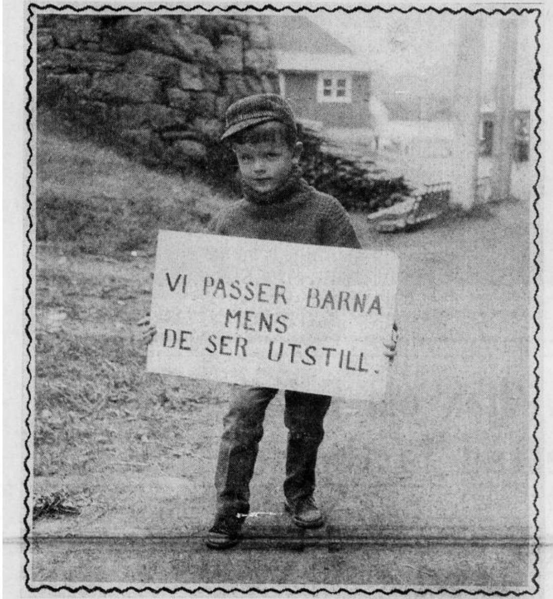
Fig 1 Fra Nordlandsposten, 29. juni 1962