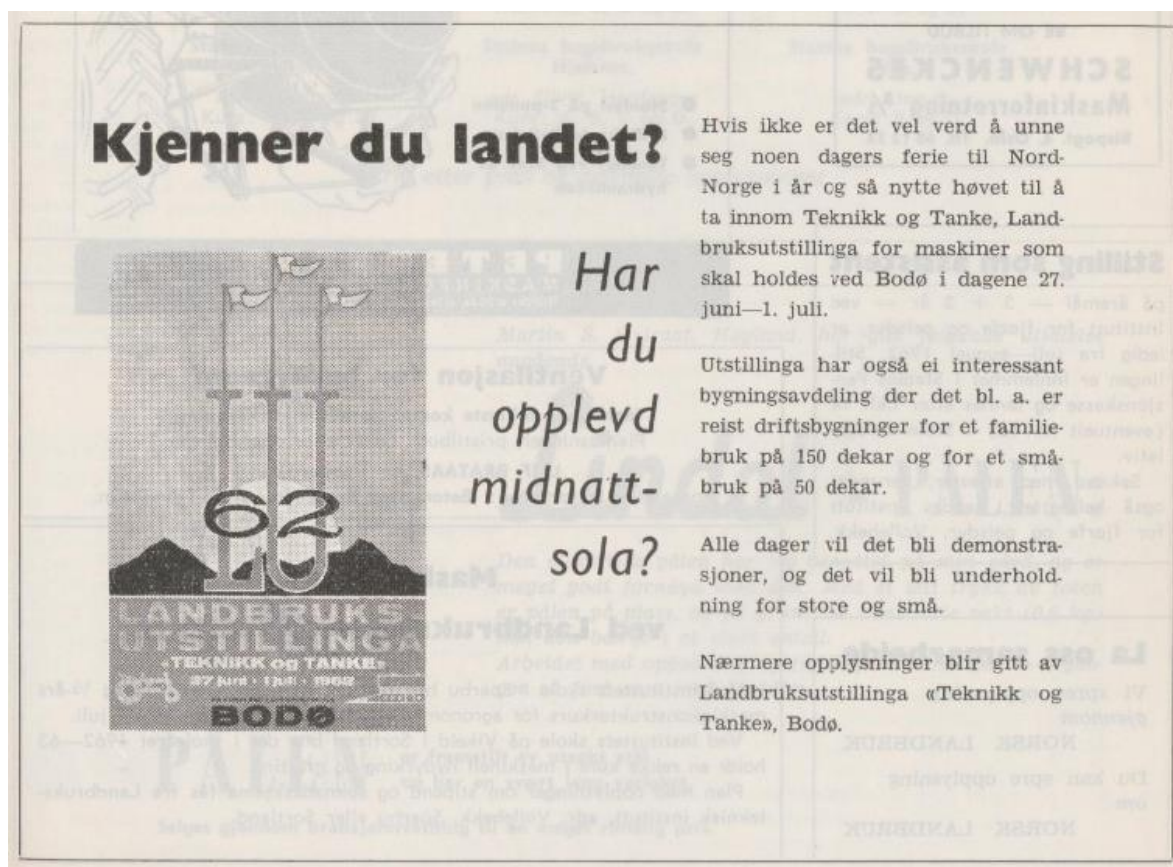
Fig. 8 Annonse for landbruksutstillingen i 1962

Utstillingen «Ting og tanke» foregikk på landbruksskolen i månedsskiftet juni – juli i 1962. Det var første gang et så stort landbruksarrangement foregikk i Nord-Norge, og inspirasjonen kom nok fra den store Ekebergutstillingen i Oslo tre år tidligere.