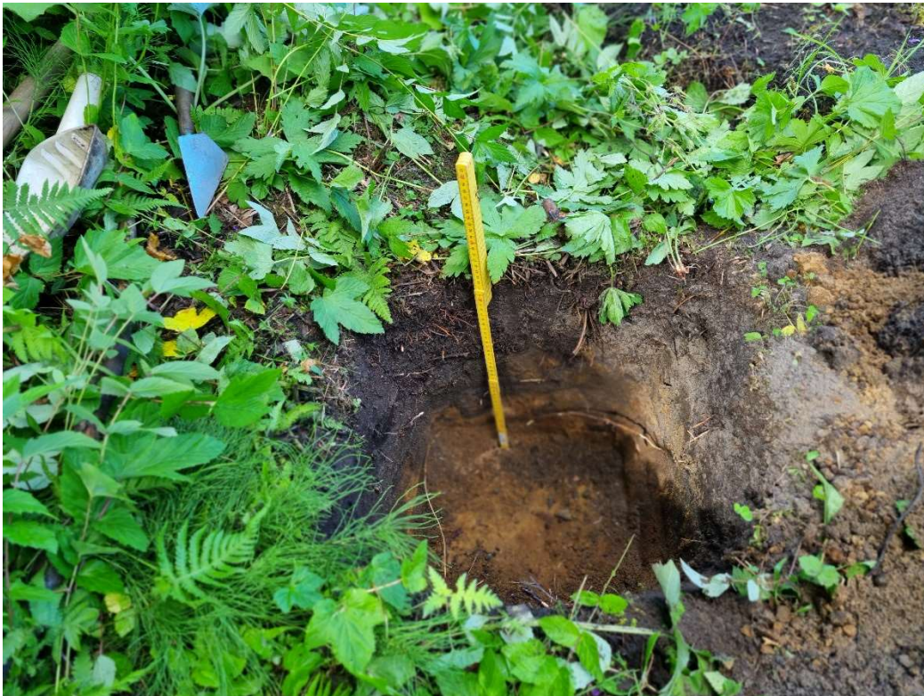
Figur 5: Stikk 2.

0 – 18 cm Torv/humus 18 – 36 cm Mørk brunlig sand 36 - cm Brunlig sand.