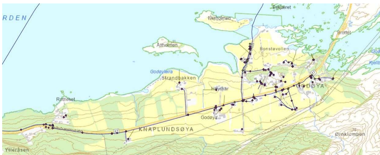
Figur 1: Vannledninger på Godøya.

Gang- og sykkelvegen planlegges bygd på sørsida av fv. 17. For noen år siden ble det lagt kommunal vannledning i den delen av planområdet på Godøya som det ville ha vært aktuelt å grave søkesjakter i. Eventuelle gamle kulturspor må derfor antas å være så sterkt forstyrret av anleggsarbeidet at sjaktning ikke lenger vurderes som hensiktsmessig.