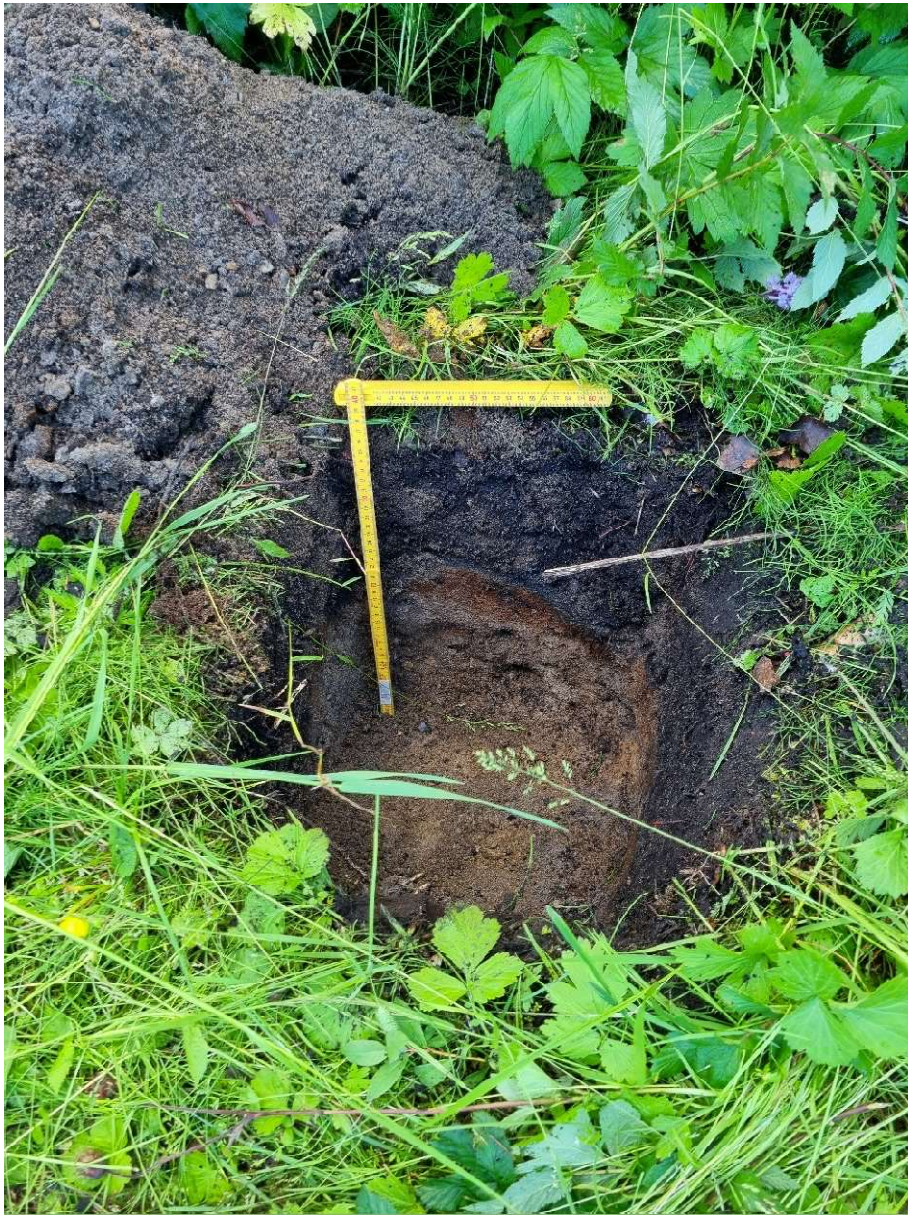
Figur 3: Stikk 1.

Lys brunlig sand med jernutfelling like under humuslaget