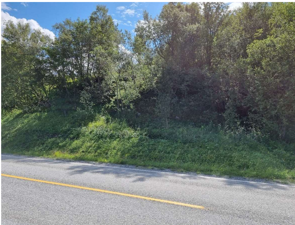
Figur 7: Stikk 2 like til venstre for sentrum av bildet. Mot sør-sørøst.