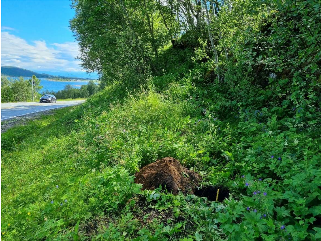
Figur 6: Stikk 2, mot øst-nordøst.