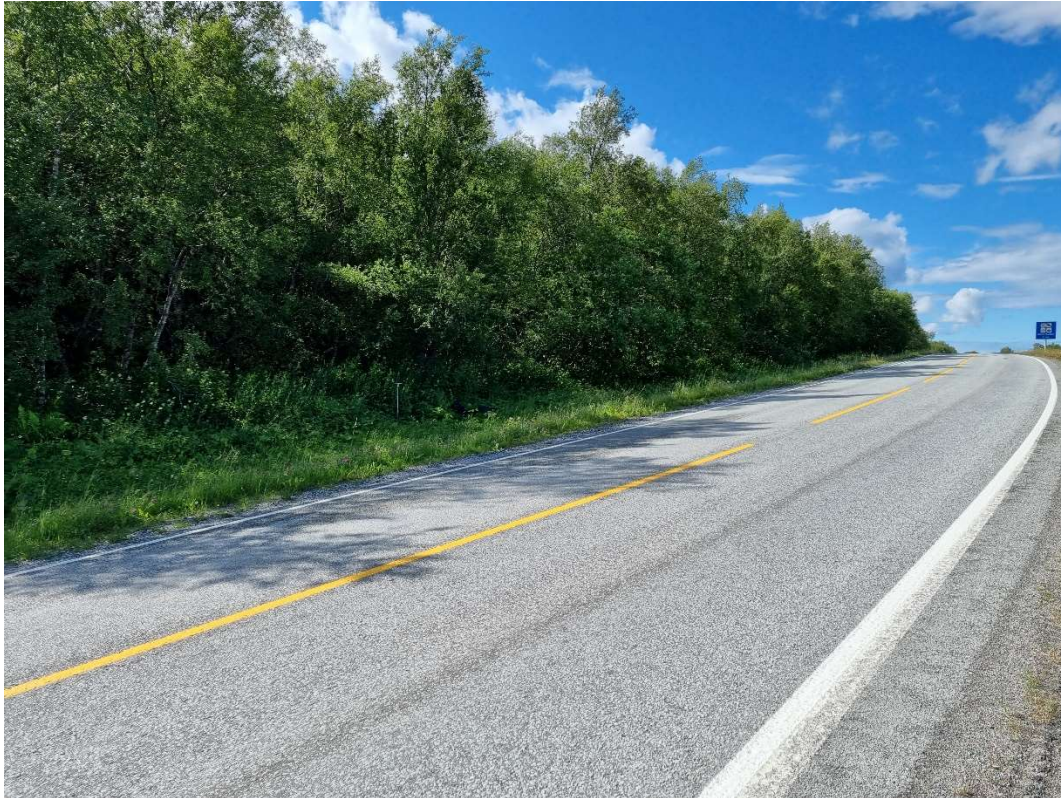
Figur 4: Stikk 1 markert med jordbor like til venstre for sentrum av bildet. Mot sørvest.