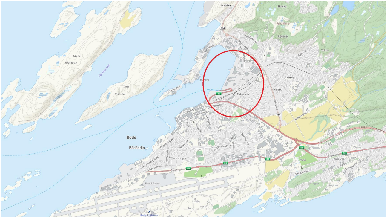
Figur 1. Planområdets beliggenhet

Planområdet ligger på Rønvikleira, nord for ferjekaia og vest for jernbanestasjonen, i Bodø kommune.