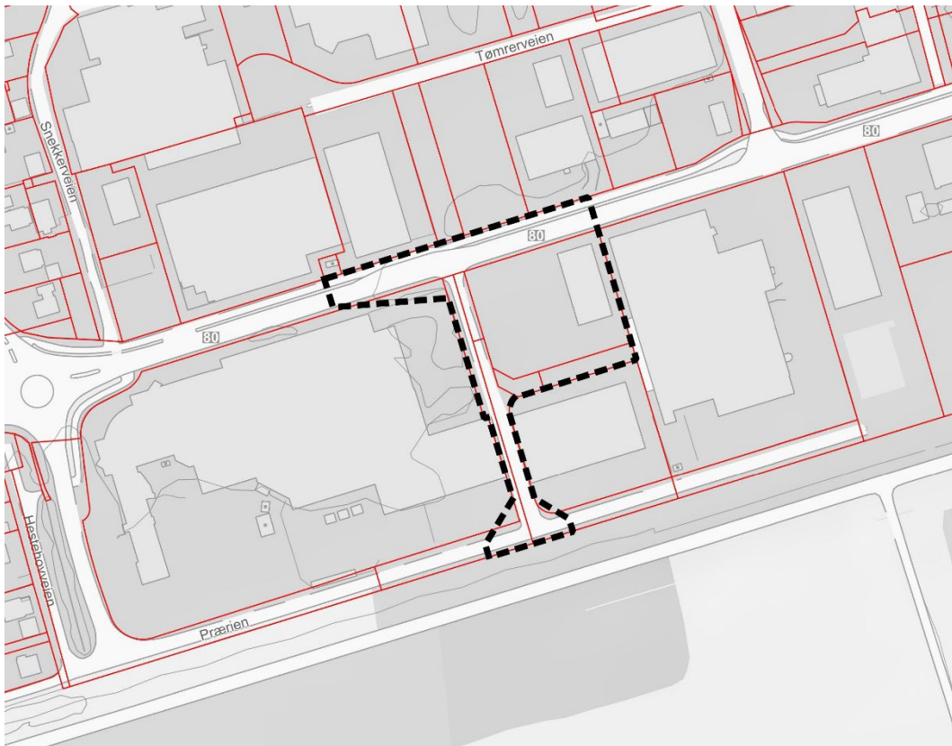
Figur 1: Varslet planavgrensning er markert med sort stiplet linje.