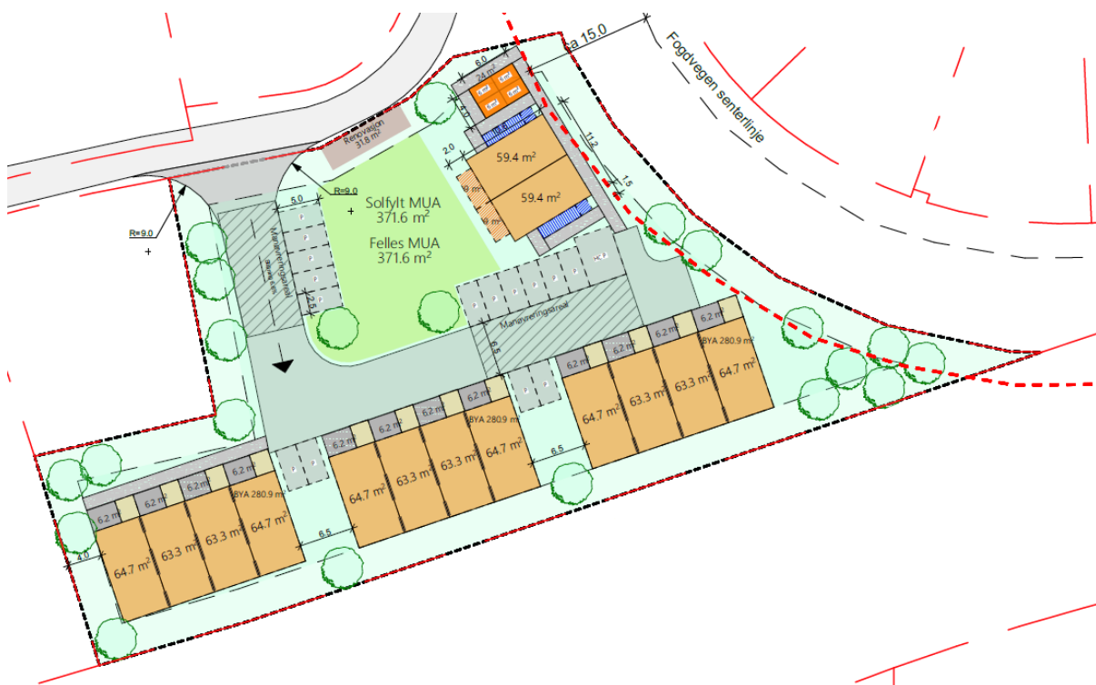
Figur 1: Situasjonsplan