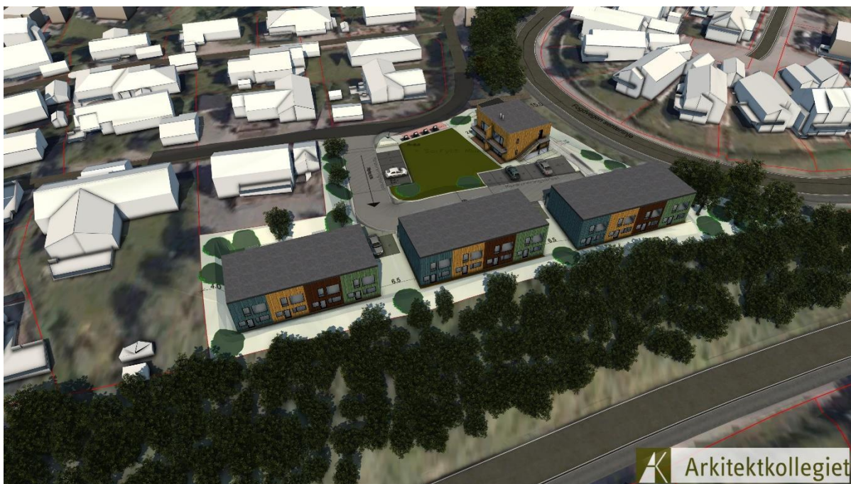
Figur 3: Perspektiv fra sør