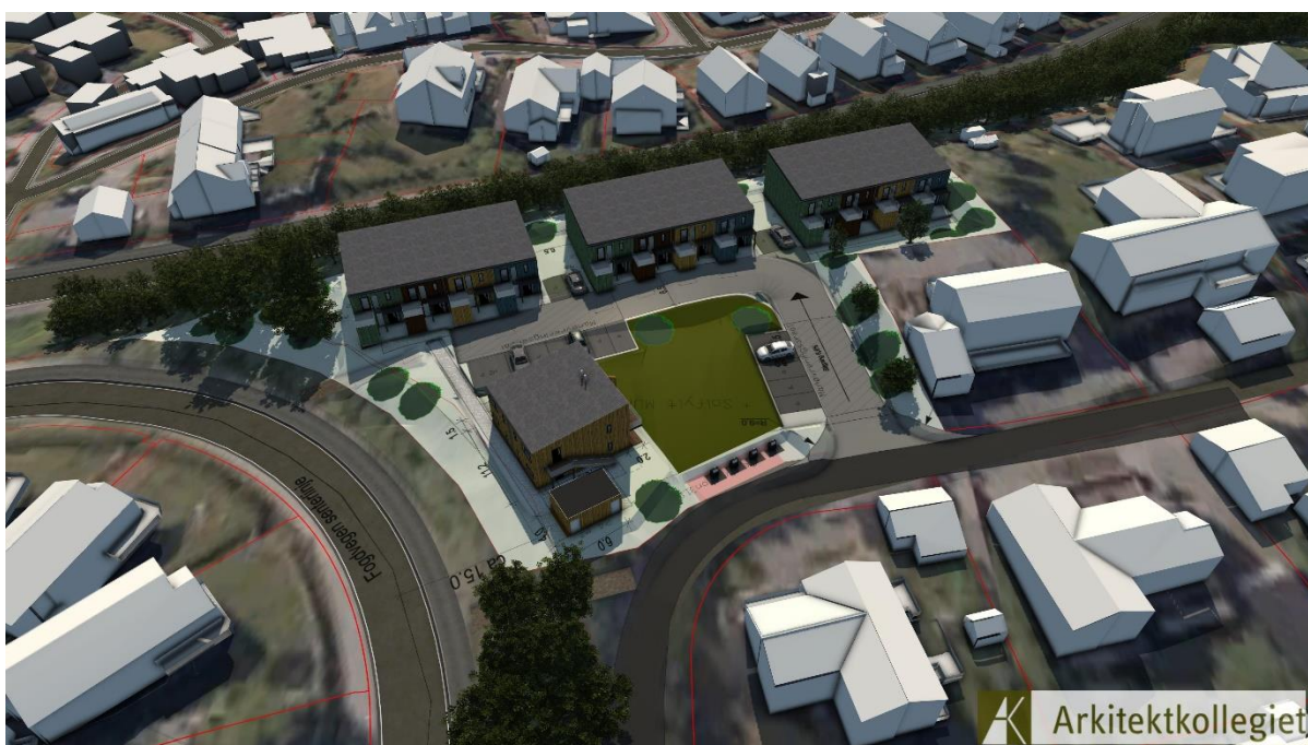
Figur 4: Perspektiv fra nord

Dette brevet sendes til alle berørte parter og andre interessenter slik at de som ønsker det kan komme med innspill til planarbeidet. Når planforslaget legges ut til offentlig ettersyn får berørte parter varsel om dette og kan komme med uttalelser og merknader innen en gitt høringsfrist. Offentlig ettersyn blir kunngjort på kommunens nettsider.