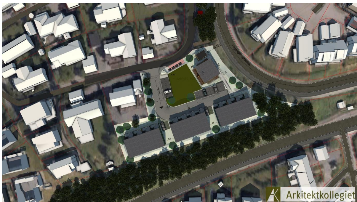
Figur 2: Situasjon 3D