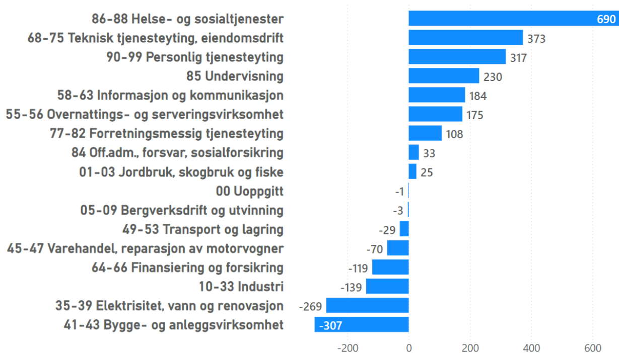
Utvikling i antall sysselsatt etter arbeidssted i Bodø fordelt på ulike bransjer i 2022