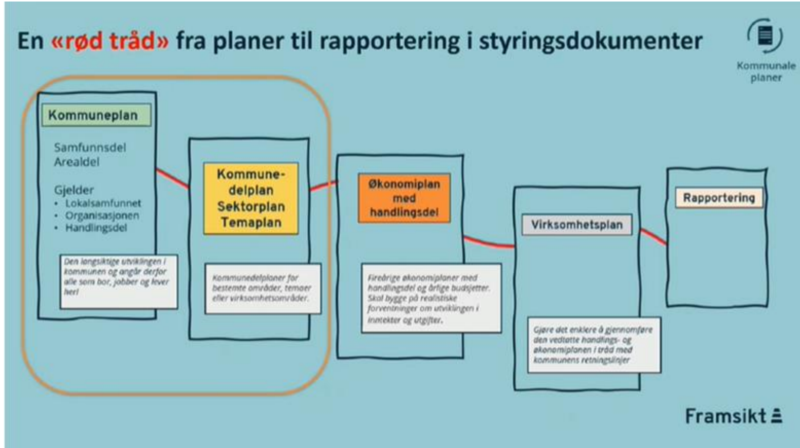
Figur 4 organisering