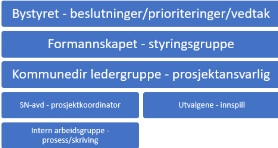
Figur 2 Organisering

Den formelle organiseringen av arbeidet med ny samfunnsdel tenkes slik: