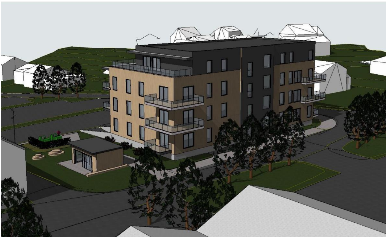
Figur 3. Planlagt bygg sett i fra sørøst.