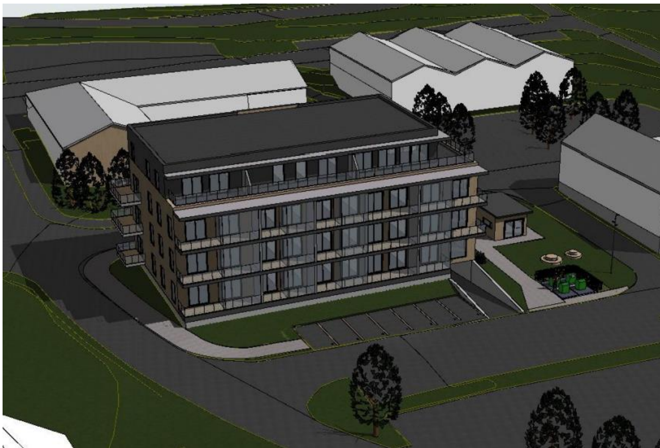
Figur 4. Planlagt bygg sett i fra vest.

Den eksisterende gangforbindelsen gjennom området er allerede sikret i planbestemmelsene i gjeldende reguleringsplan (§ 2.11), men vil ikke være mulig å opprettholde på dagens plassering på grunn av konflikt med det opprinnelige byggets fotavtrykk. Ved å flytte uteoppholdsarealet kan gangforbindelsen og siktaksen øst/vest mot havet bevares. Dette grepet bidrar også til å gjøre området mer tilgjengelig for allmennheten og skaper samtidig en ny forbindelse mellom planområdets uteareal og de eksisterende torgarealene øst og sørøst for planområdet. Dette vil bidra positivt til Mølnbakken ved at prosjektet tilfører nye kvaliteter til området, samtidig som det opprettholder den ønskede henvendelsen til omgivelsene.