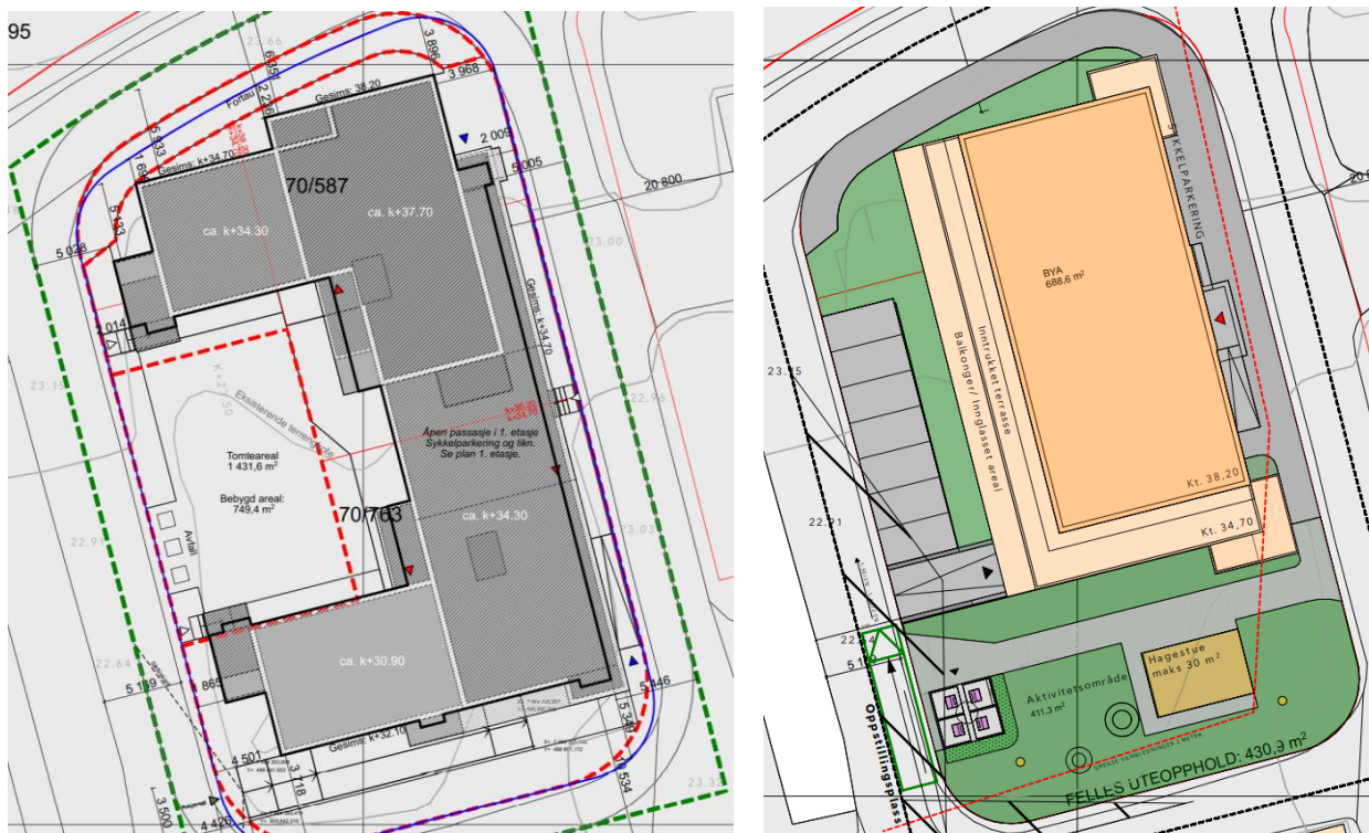
Figur 1. Til venstre: Utsnitt fra tidligere situasjonsplan utarbeidet som grunnlag for gjeldende reguleringsplan. Til høyre: Ny situasjonsplan som grunnlag for forslag til reguleringsendring. Situasjonsplanene viser at fotavtrykket på det planlagte leilighetsbygget reduseres til en mer kompakt bygningskropp, samt at uteoppholdsarealet flyttes fra vest til sør.

Endringene som nå gjøres i prosjektet innebærer at det nye bygget blir mindre enn det som opprinnelig var planlagt. Som følge av dette er fotavtrykket vesentlig redusert og bygget er trukket inn til en mer kompakt og rektangulær bygningskropp som plasseres i nordøstlig del av planområdet. Dette gjør at man går bort fra den opprinnelige tanken om kvartalsstruktur der bygget ville bidratt til å definere de omkringliggende gatene. I stedet for en variasjon i byggehøydene legges det opp til en generell høyde på 4 etasjer, men med en tilbaketrukket toppetasje mot sør og vest.