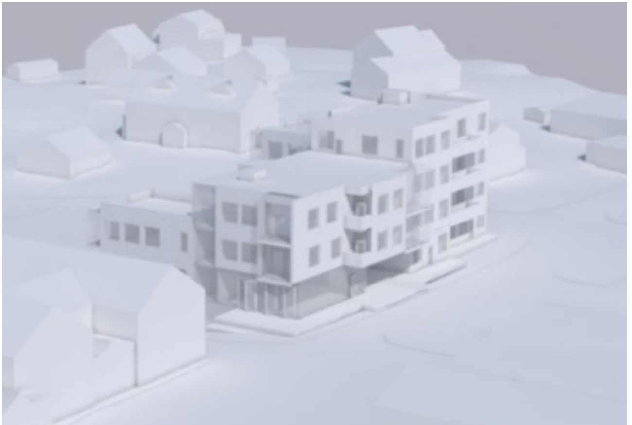
Figur 2. Planlagt utforming av prosjektet fra 2018 sett i fra sørøst. Illustrasjonen viser et oppdelt bygningsvolum med ulike byggehøyder og en nedtrapping fra fire etasjer i nord til to etasjer mot vest og tre etasjer og sør.