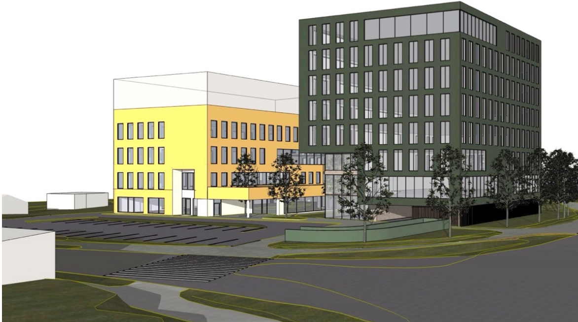
Figur 4 perspektiv 1

Det planlegges bebyggelse på inntil åtte etasjer, med en regulert gesimshøyde på kt+43 i tråd med hinderflater for Bodø lufthavn. Ny bebyggelse forholder seg til eksisterende bebyggelse i eksisterende reguleringsplan. Det tilrettelegges for parkering på byggets første plan, og for mulig anlegg under terreng med f.eks. parkeringskjeller, tekniske areal el. lignende. Ny byggegrense i planen etableres bl.a. for å ivareta fremtidige grønne akser imellom den nye bydelen i sør og eksisterende by. Anslått BRA er 6 500-7 000 m 2 .