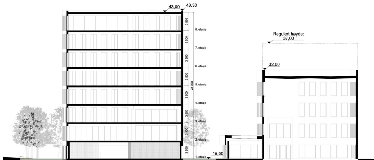
Figur 6 Snitt