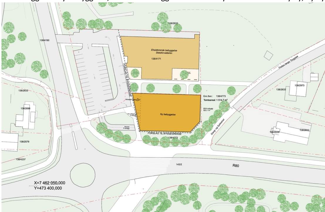
Figur 3 Situasjonsplan

Hensikten med planen er å rive eksisterende boligbrakke, og tilrettelegge for utbygging av næringsvirksomhet i Fridtjof Nansens vei 11 felt BN2. Det er ønskelig å tilrettelegge for utbygging av kombinert formål kontor, hotell og tjenesteyting innenfor rammene av kommuneplanens arealdel. I ny plan ønsker en å oppheve eksisterende plan med hensynssone for Fridtjof Nansens vei 11, tilrettelegge for ny bebyggelse, samt tilrettelegge for deler av ny infrastruktur til ny by, ny flyplass.