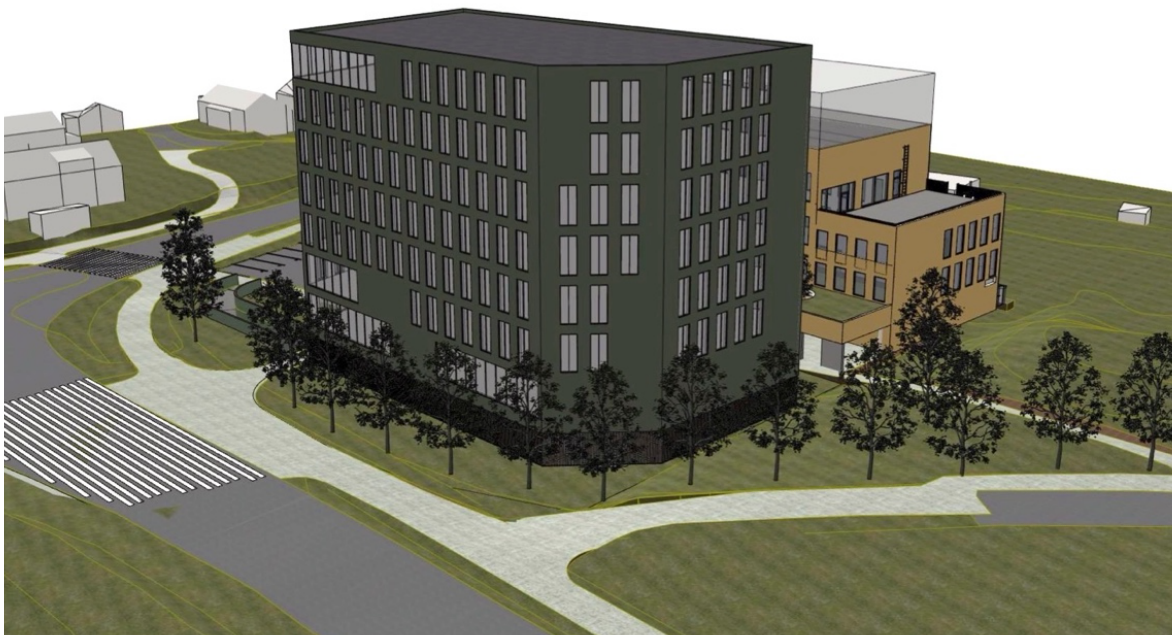
Figur 5 Perspektiv 2