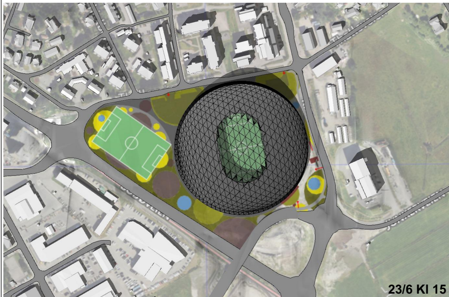
23/6 KI 15