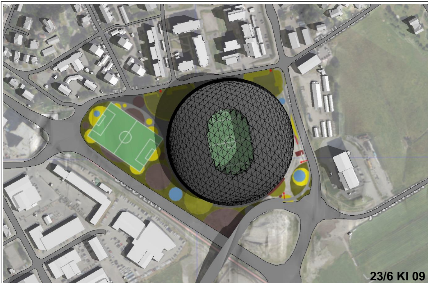
23/6 KI 09