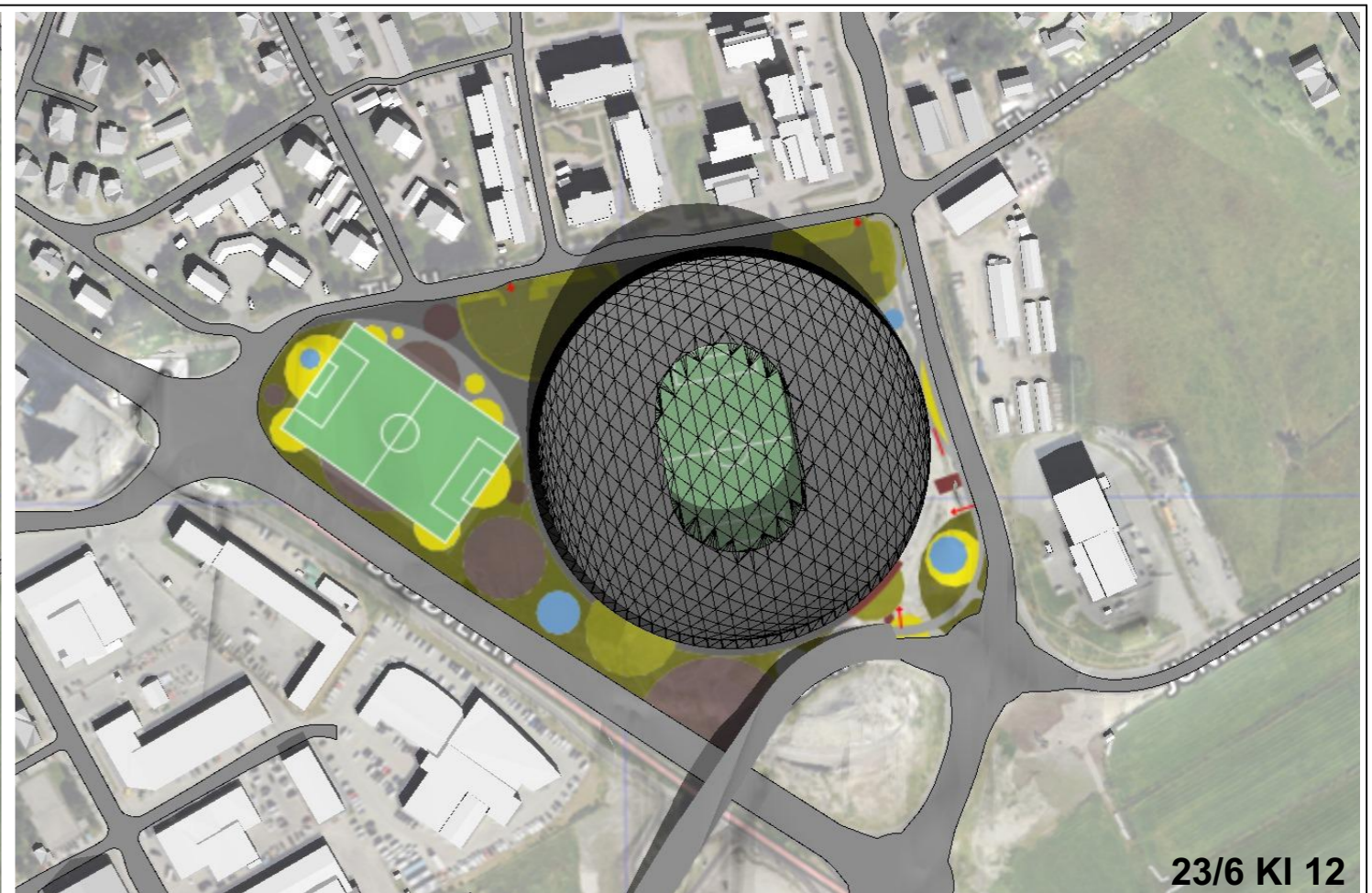
23/6 KI 12