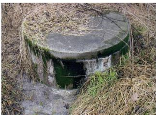
Et avløpsanlegg som ikke fungerer kan se slik ut.

Hvilke anlegg som kan bygges hos deg må vurderes av fagkyndig, og er avhengig av grunnforholdene som finnes på tomten din.