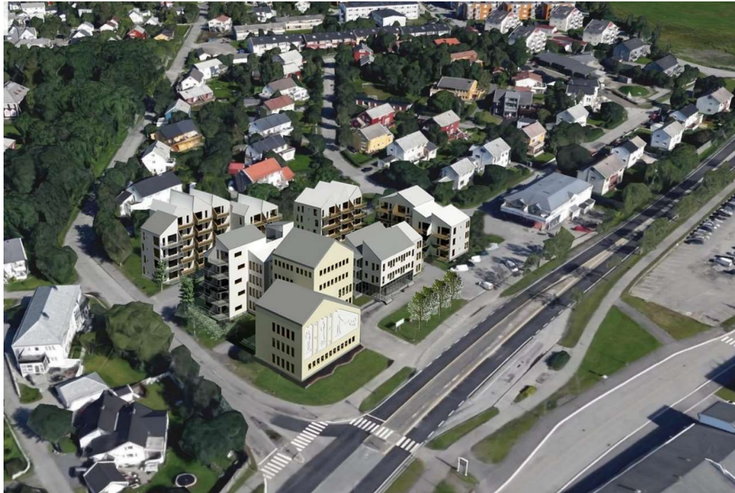
Figur 2. Skisse for Herredshuset med ny bebyggelse, sett fra sydvest. Ett av flere mulige utbyggingsformer. Tegning BOARCH arkitekter a.s april 2020. Bakgrunn fra Google Earth.