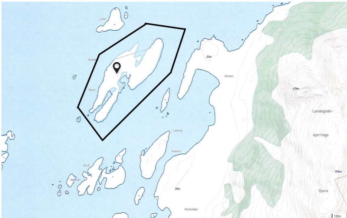
Store Kalvøya med planområdet angitt med svart strek