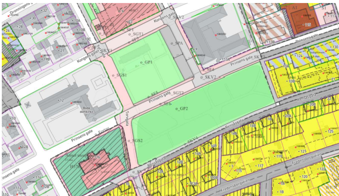
Plansituasjonen i området

Prinsens gate mellom parkene er på nærmeste ferdig opparbeidet etter utformingsplan vedtatt av bystyret 08.02.2019, sak 18/5.