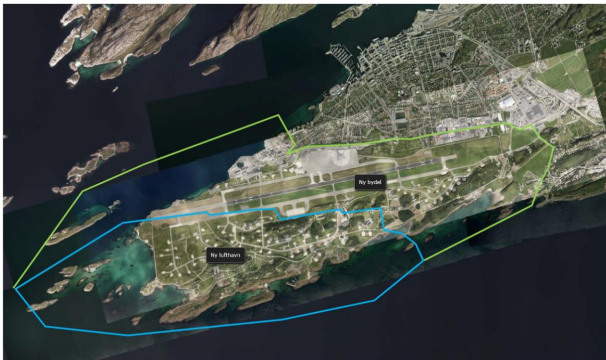
Figur 1: planavgrensning for områderegulering av ny lufthavn (blå) og kommunedelplan for ny bydel (grønn)

Høsten 2018 var det oppstart på planprosessen for kommunedelplan for ny bydel (figur 1, grønn avgrensning). Statens vegvesen har i samarbeid med Bodø kommune startet opp et arbeid med alternativvurdering for ny adkomstløsning til ny lufthavn. Samtidig jobber samferdselsetatene i Bodø med oppdrag fra Samferdselsdepartementet om en konseptvalgutredning for