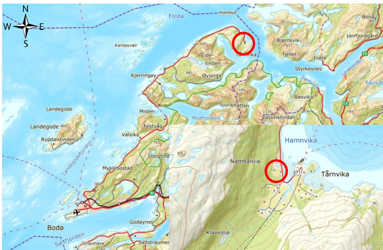
Figur 1 Oversiktskart fra Kartverket; www.norgeskart.no