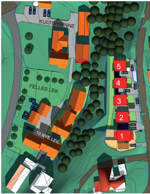
1. Aug kl.12