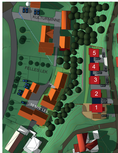
1. Aug kl. 18