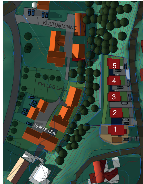
1. Sept kl. 18

Reguleringsplan ID 2018017: Komplettering til 1.Gangs behandling