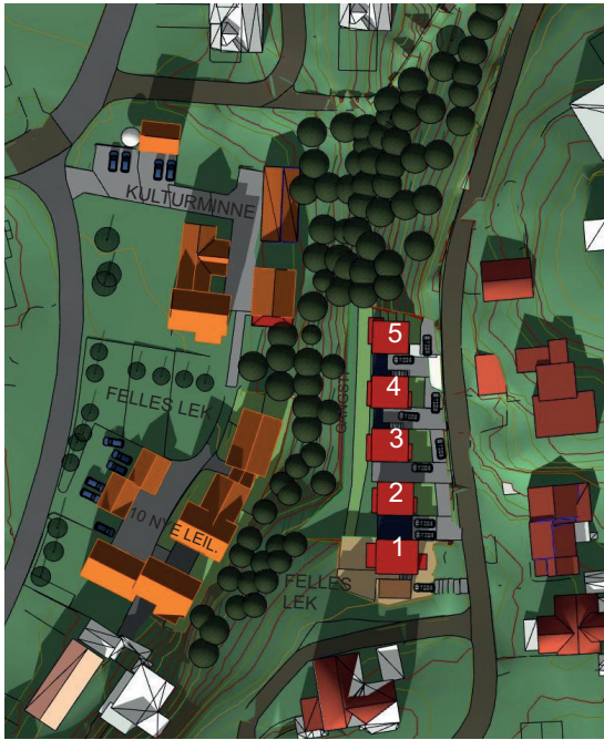
21. mars kl. 13