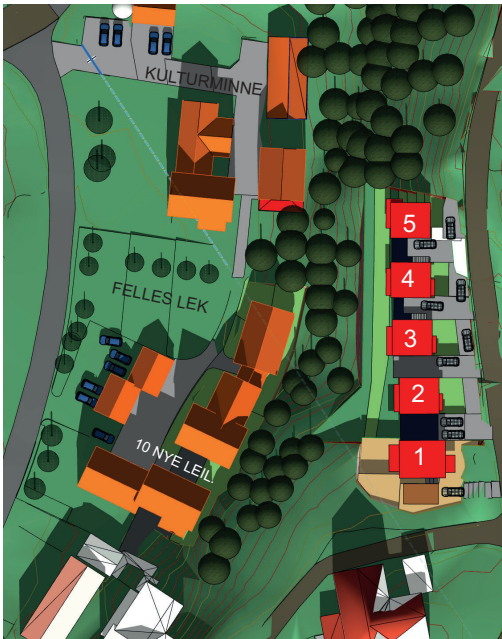
1. Sept kl.12