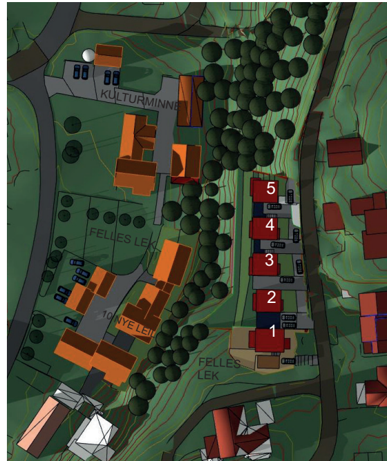
21. mars kl. 17