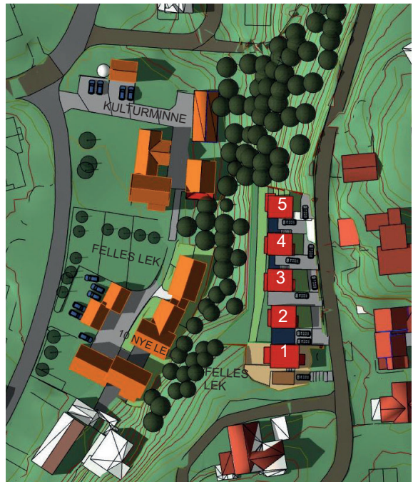
23. juni kl. 17