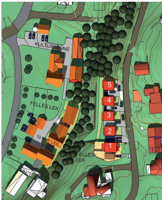
23. juni kl. 13