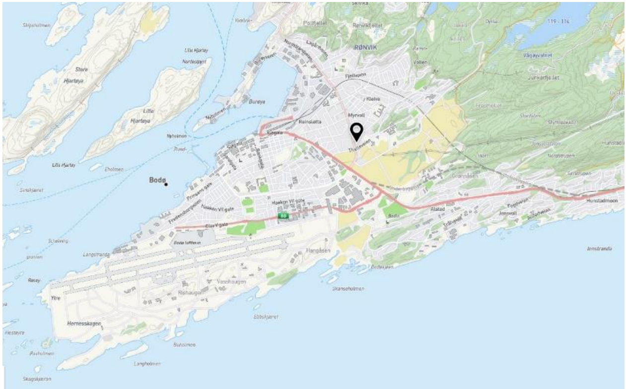
III. 1: Planområdet i forhold til Bodø.