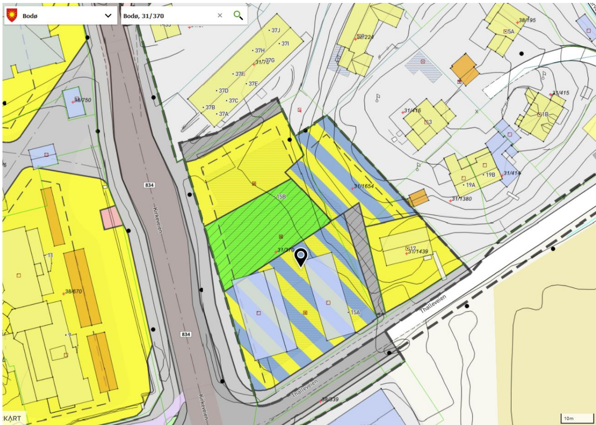
III.4. Gjeldende reguleringsplan for Kirkeveien 39/Thalleveien 17, PlanID 1146_06