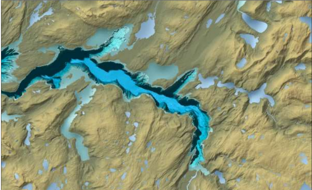
Kartutsnittet viser terrenget i/ved planområdet, kilde; Norgeskart.