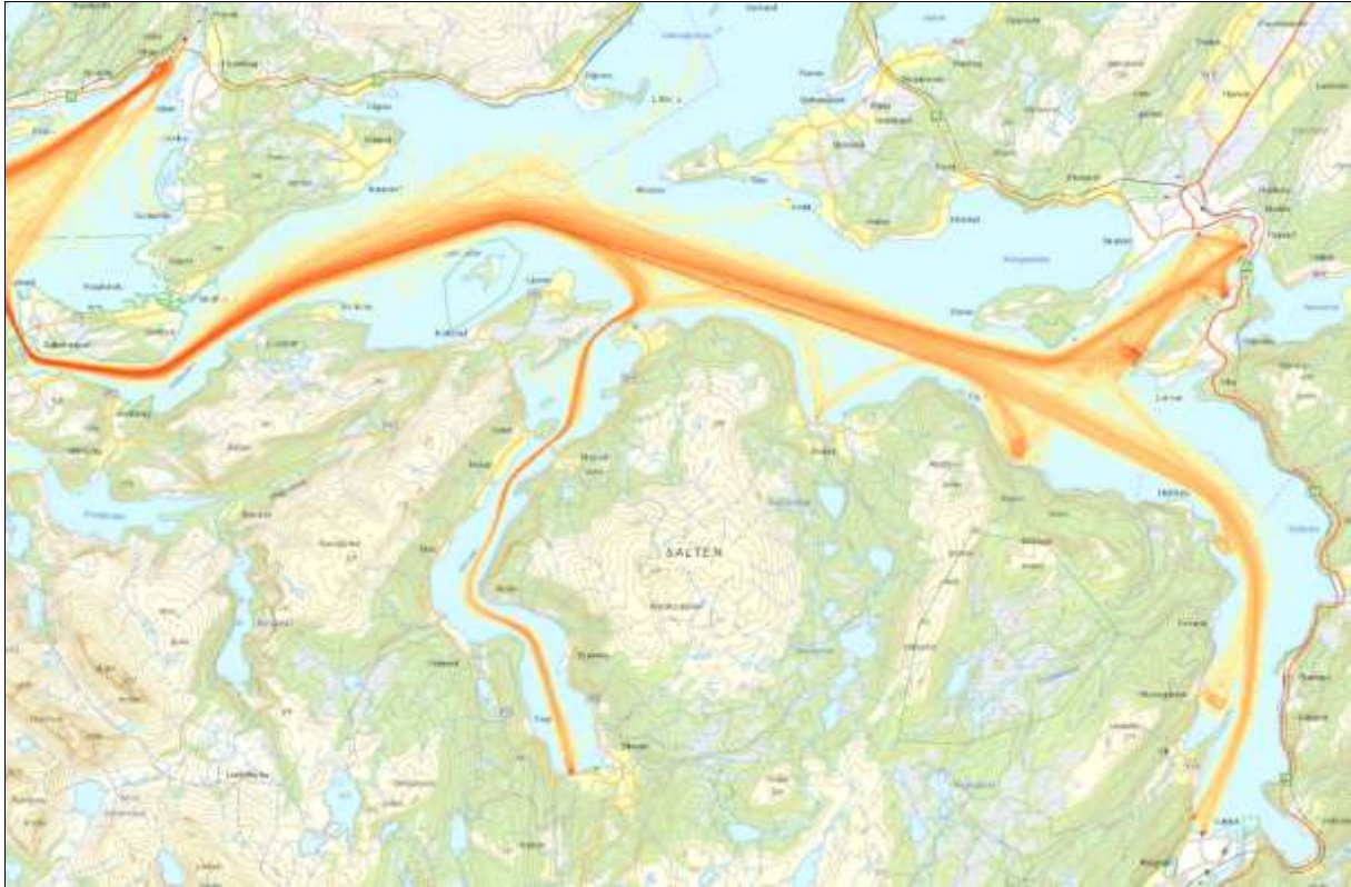
Kartutsnittet viser farleder i fjordsystemet