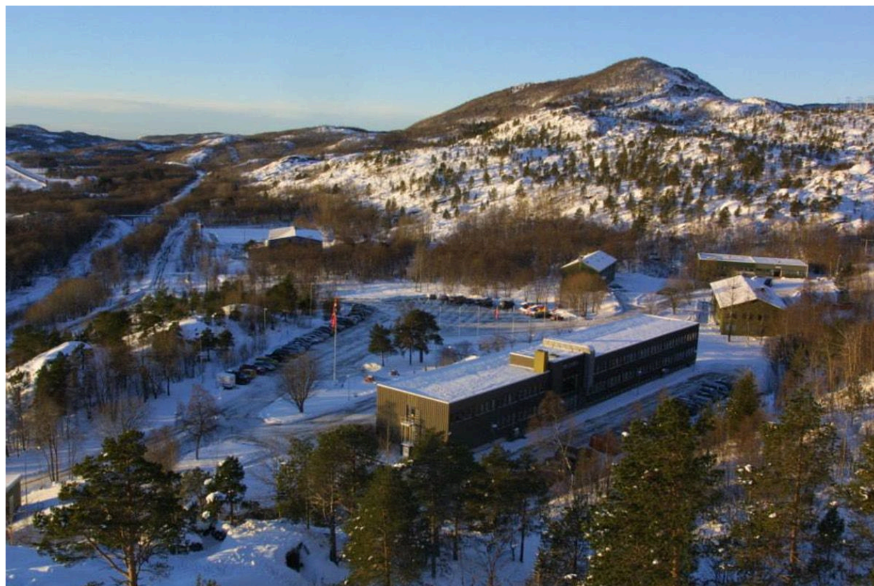
Figur 1: Forsvarets operative hovedkvarter (FOH).

Planinitiativet er utarbeidet av 3RW arkitekter, på vegne av Forsvarsbygg.