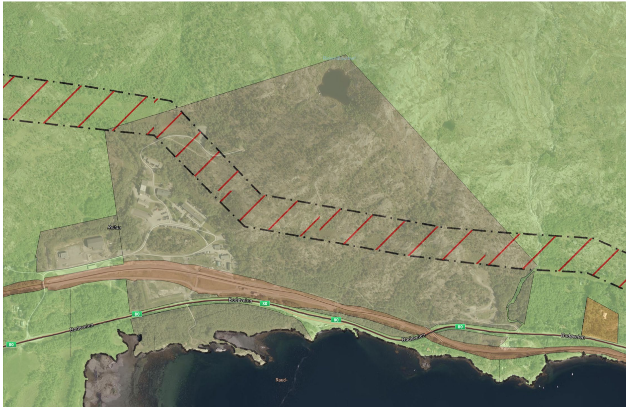
Figur 4: Utklipp KPA.

Planområdets hoveddeler omfattes av formål Forsvaret i gjeldende kommuneplanens arealdel 2022 – 2034 (KPA) for Bodø kommune. KPA angir følgende bestemmelse for formålet: