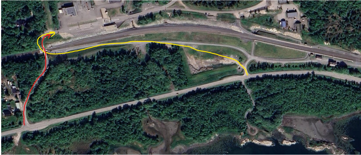
Figur 6: Prinsippskisse av mulig løsning til ny trasé for adkomstveg til Reitan fra Bodøveien, vist med gul pil. Dagens adkomstveg vises med rød pil. Bakgrunnskart: Google Maps