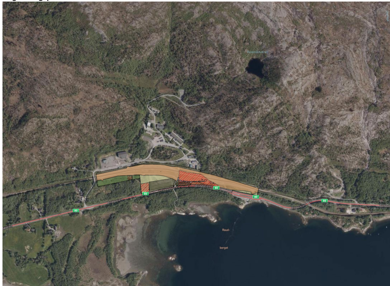
Figur 5: Gjeldende reguleringsplaner i området.

Det foreligger en vedtatt reguleringsplan for Oteråga stasjon og kryssingsspor (planID: 2016009) som ble vedtatt i 2018 innenfor planavgrensningen. Reguleringsplanen forventes i stor grad videreført i Forsvarsbyggs plan, men med eventuelle endringer hvor det planlegges ny adkomst og bro.